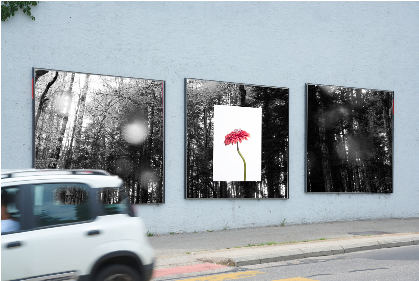
Montage provisoire.