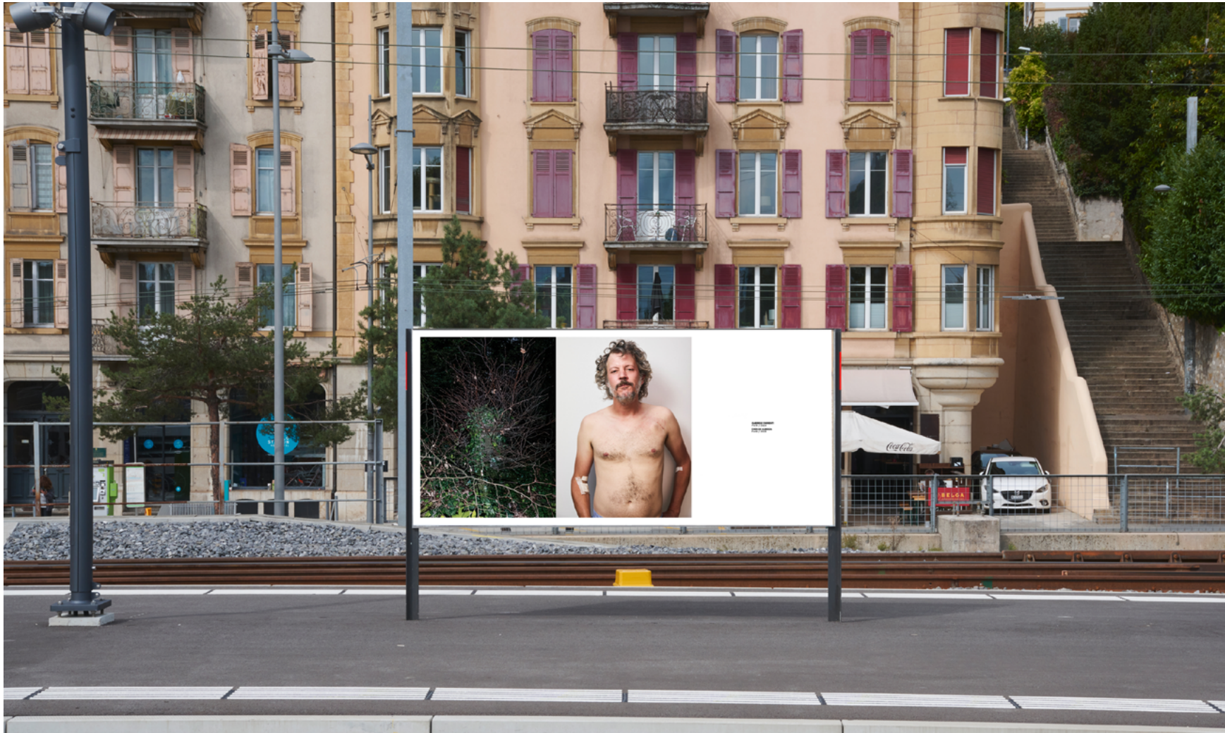
Montage provisoire.