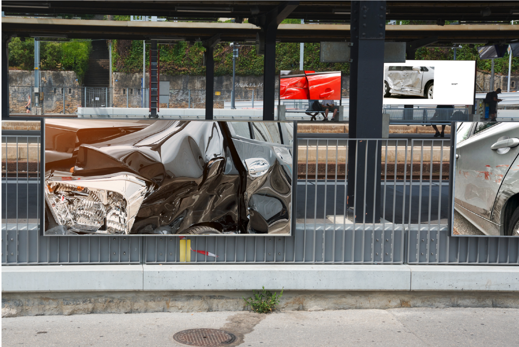
Montage provisoire.