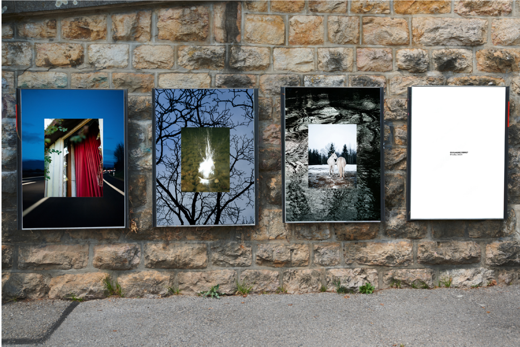
Montage provisoire.