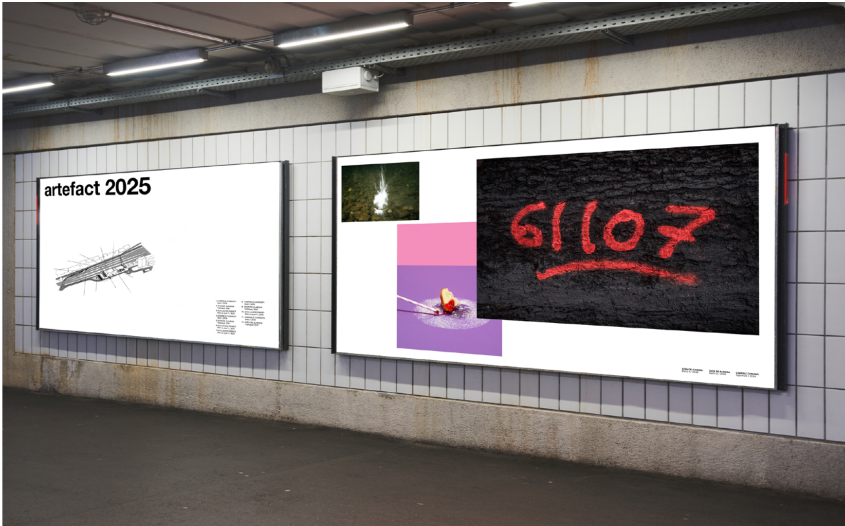
Montage provisoire.