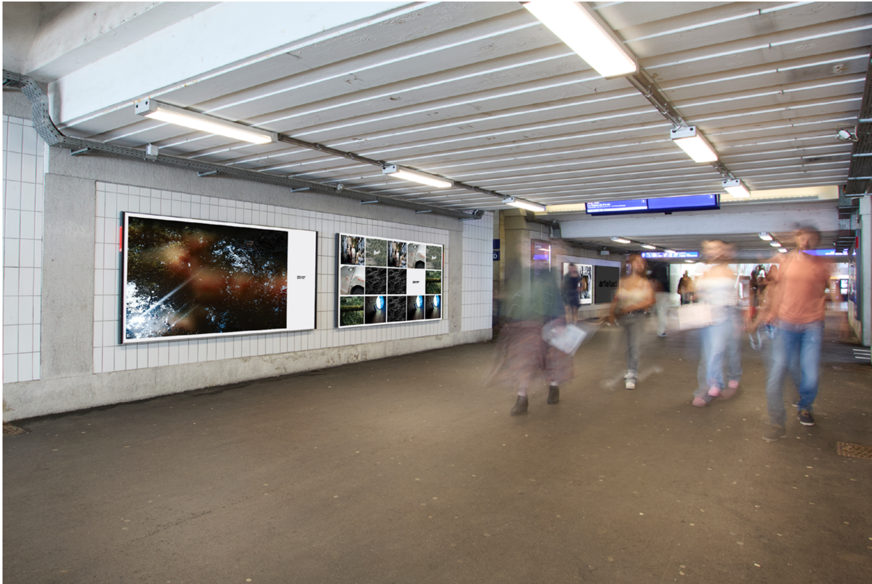
Montage provisoire.