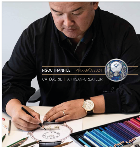
Dossier de candidature Prix Gaïa.